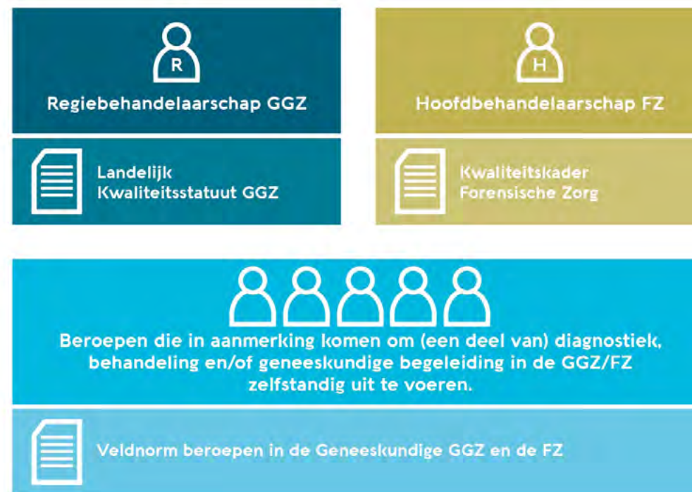
Figuur: Verhouding Veldnorm tot Landelijk Kwaliteitsstatuut GGZ en Kwaliteitskader Forensische Zorg

Deze veldnorm is het startpunt en het sluitstuk van veel andere afspraken over kwaliteit. Deze zijn vastgelegd in richtlijnen en veldnormen die beschreven wat kwaliteit van zorg is. Op basis van deze bestaande normen heeft Akwa GGZ een overzicht gemaakt van de beroepen die een rol hebben in ggz en fz. Op basis van objectieve kwaliteitscriteria is vervolgens bepaald welke van die beroepen in aanmerking komen om (een deel van) diagnostiek, behandeling en/of geneeskundige begeleiding zelfstandig uit te voeren. Daarmee is deze veldnorm ook weer input voor andere veldnormen en richtlijnen die zorg beschrijven. Met deze veldnorm borgen wij dat iedereen dezelfde basisnormen hanteert bij het inzetten van beroepen in de ggz en fz.